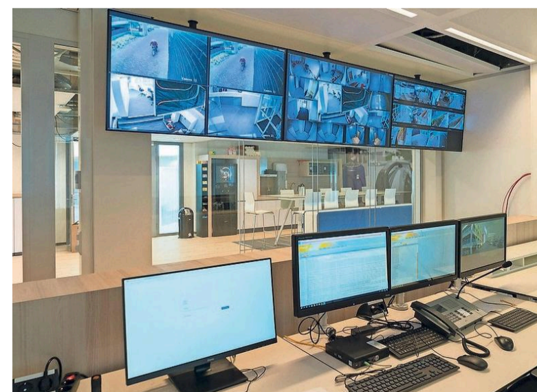
De commandoruimte die nu dichtbij de entree zit.